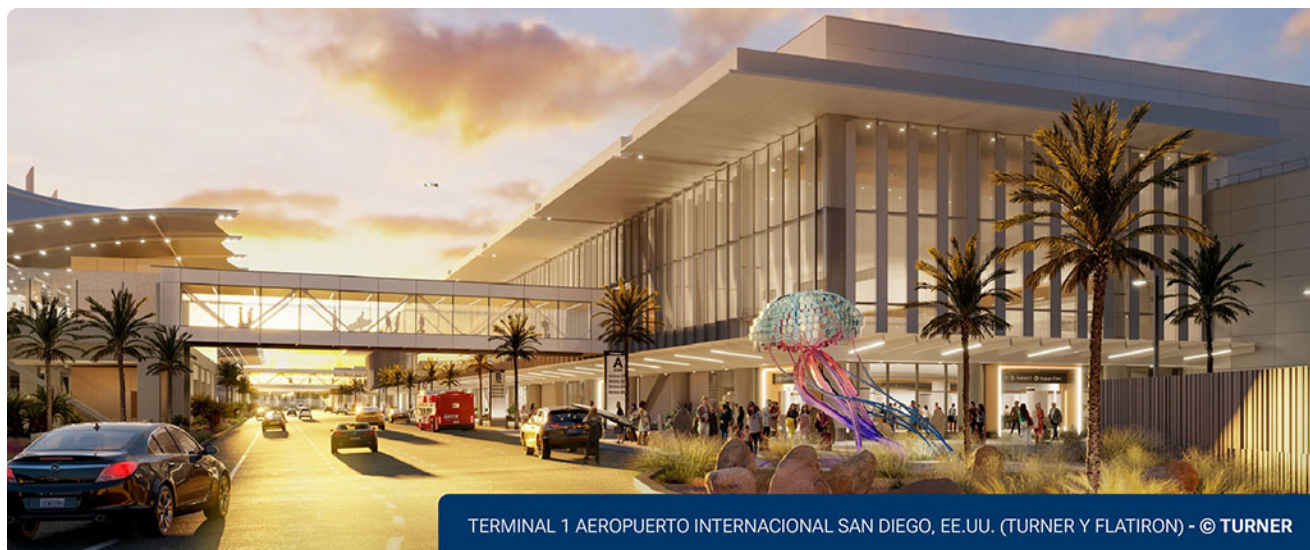
TERMINAL 1 AEROPUERTO INTERNACIONAL SAN DIEGO, EE.UU. (TURNER Y FLATIRON)