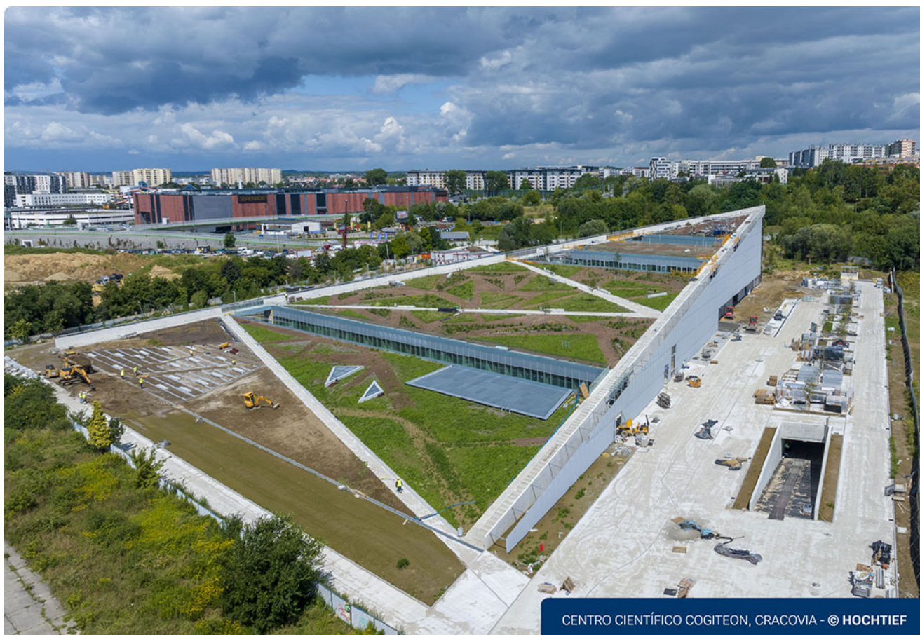
CENTRO CIENTÍFICO COGITEON, CRACOVIA

Código de Conducta para Socios de Negocio